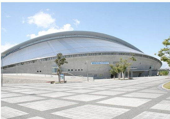
セキスイハイムスーパーアリーナ (宮城県総合運動公園総合体育館)

式典に参加いただいた方への感謝の意を込め、式典行事のフィナーレを飾るに相応しいアトラクションを企画、実施します。