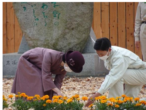
第45回全国育樹祭のお手入れ行事の様子（令和4年：大分県）