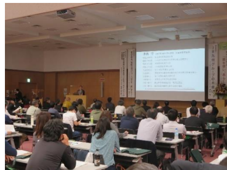
育林交流集会 (令和4年：大分県)