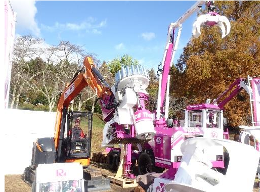
森林・林業・環境機械展示実演会 (令和4年：大分県)