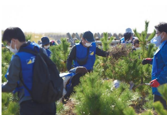
海岸防災林保育活動