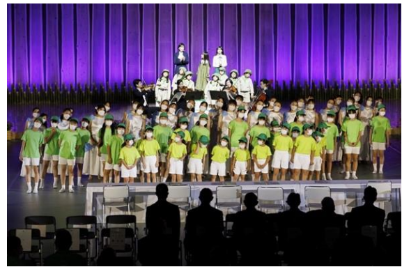
第45回全国育樹祭の式典行事の様子 (令和4年：大分県)