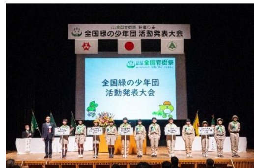
全国緑の少年団活動発表大会 (令和4年：大分県)