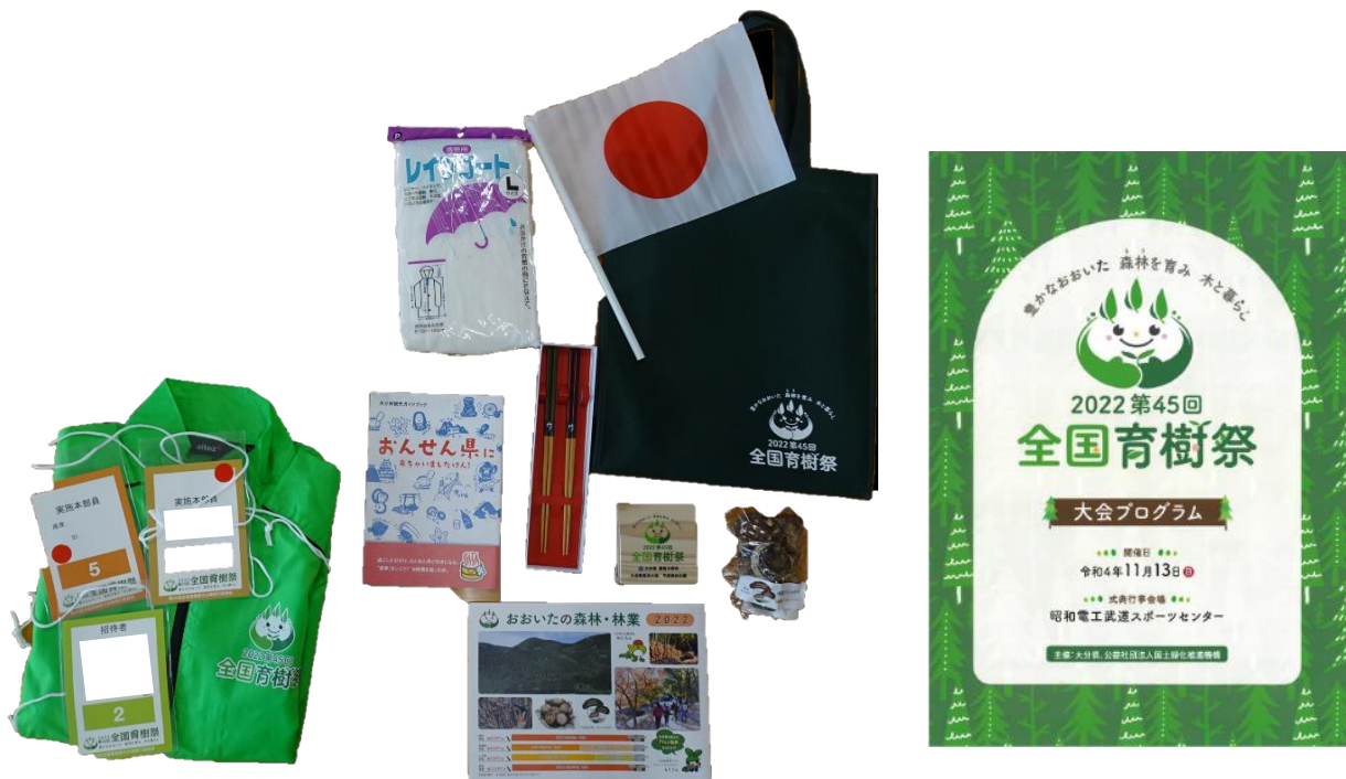
参加記念品及び大会パンフレット等（令和4年：大分県）

第48回全国育樹祭への参加を記念し、本県らしい記念品を贈呈します。また、会場で使用する物品のほか、本県の取組、名所等を紹介するパンフレットなどを配布します。