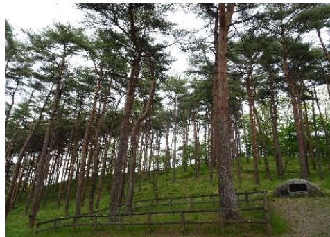
御手植えのアカマツ