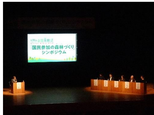
国民参加の森林づくりシンポジウム (令和4年：茨城県)