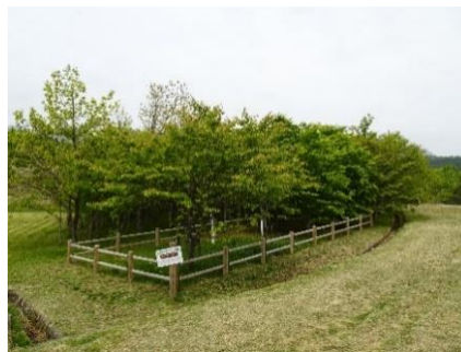
御手植えのブナとオオヤマザクラ