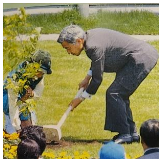
第48回全国植樹祭の様子

平成9年5月18日に白石市(国立花山青少年自然の家南蔵王野営場)において、天皇皇后両陛下をお迎えして開催しました。「森づくり 大地に託す 夢・未来」をテーマとして、ブナやオオヤマザクラのお手植えや参加者による記念植樹などが行われました。当時、広大な原野であった植樹祭会場は、現在は豊かな森林へと姿を変え、「未来の森」として引き継がれています。