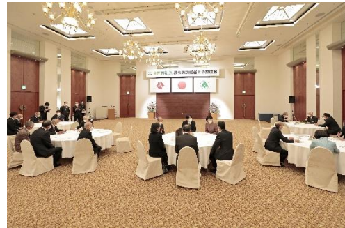
緑化等功労者との交流会 (令和4年：大分県)